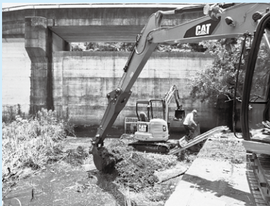
▲雨水貯留池に堆積した土砂の撤去

令和5年6月2日の大雨により被災した土木施設の復旧に係る経費として、市内18か所の河川や雨水貯留池等に堆積した土砂等の撤去に係る費用1,995万円や排水ポンプが停止した白滝排水機場の仮設ポンプ設置等に係る経費9,180万円など。