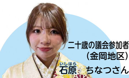
二十歳の議会参加者 (金岡地区)