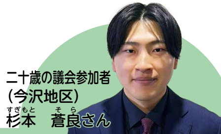
二十歳の議会参加者 (今沢地区)