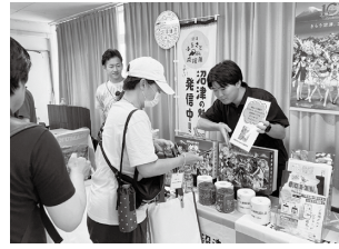
▲ふるさと納税のPRブース

本市の認知度拡大を図るため、様々なシティプロモーションを実施するとともに、ふるさと納税制度を通じて本市のファンとなった人たちとの交流を深める取組を実施します。