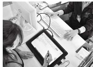
▲デジタル化された窓口手続

市民に寄り添ったサービスを提供するため、窓口手続の効率化を図ります。また、高度な知識や経験を有するCIO補佐官を置き、進化するデジタル技術を効果的に活用し、柔軟に各施策に取り組みます。