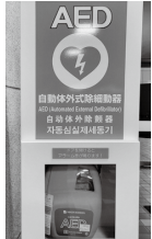
▲救命救急機器であるAED

市内49か所の24時間営業のコンビニエンスストアにAEDを設置し、傷病者の救命率の向上を図ることで、市民の安全・安心の確保に努めます。