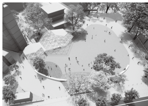
▲中央公園の完成予想図

中央公園をさらに魅力ある空間へ再整備するため、令和8年度末の供用開始に向け、大屋根や上下の広場をつなぐ大階段を設置するほか、芝生広場やトイレの改修等の工事を引き続き進めます。