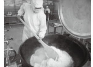
▲子どもたちのために給食を作る調理師