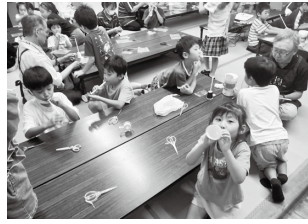
▲工作中の子どもたち

放課後等に保護者が不在の児童に対し、適切な遊び及び生活の場を提供し、児童の健全な育成を図るもので、新たな取組としてより子育てしやすい環境をつくるため、第2子以降の指導料を一律半額に軽減します。