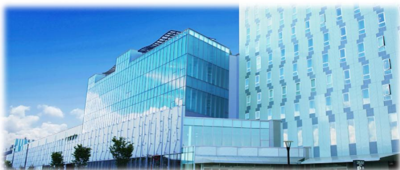
総合コンベンション施設 プラザ ヴェルデ

今後も、本市が県東部地域の拠点都市としての役割を担いながら、「効率的な都市経営」と「環境との共生」の両立を図る「環境共生型多核都市」構造の都市を形成しつつ、都市全体の持続的な発展を目指していきます。