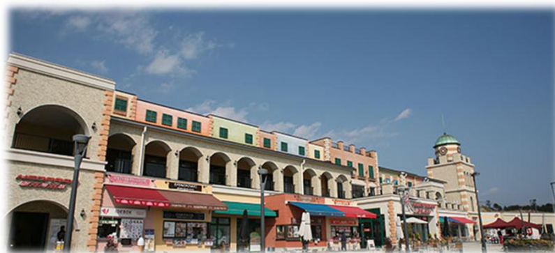
NEOPASA駿河湾沼津サービスエリア