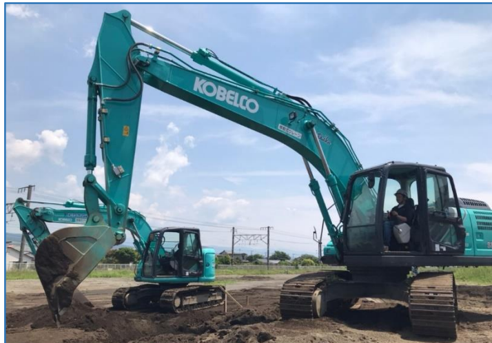
①造成工事：地面が一定の高さになるよう整地しています