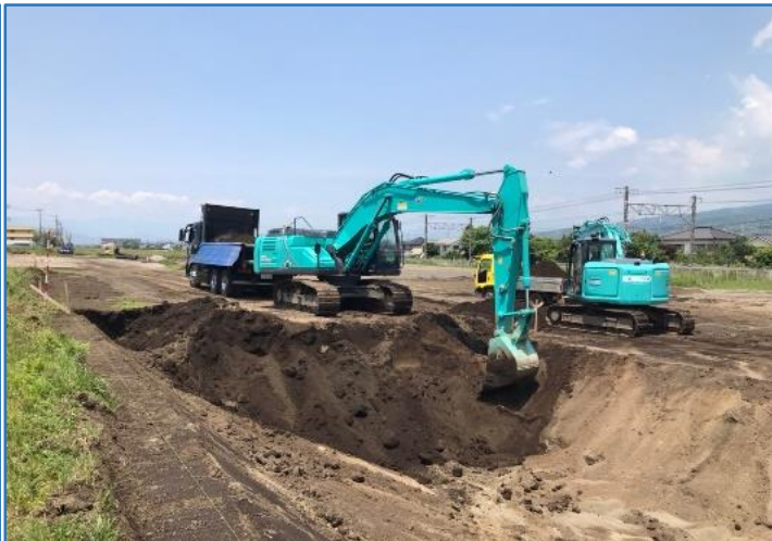
②調整池築造工事：雨水を溜める池を掘っています