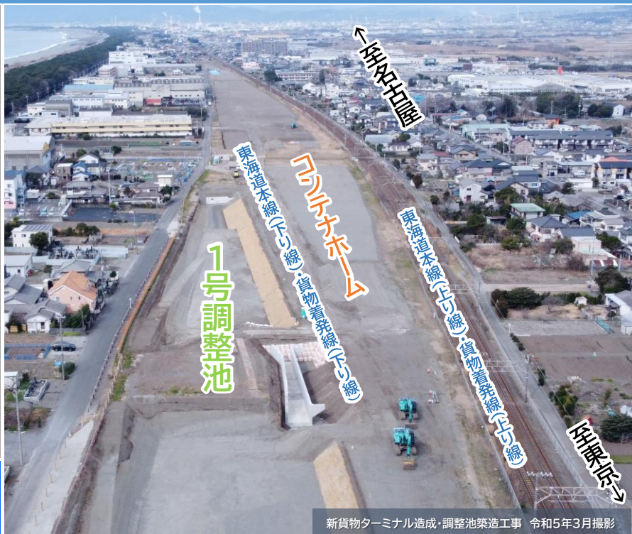
新貨物ターミナル造成・調整池築造工事 令和5年3月撮影

10月からはいよいよ新貨物ターミナルの鉄道施設工事が始まります。これにより、沼津駅周辺総合整備事業がまた一歩前進します。