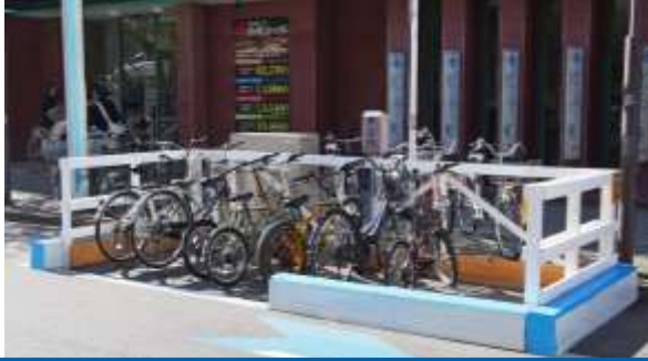
ゼブラ内に 駐輪場の整備を検討