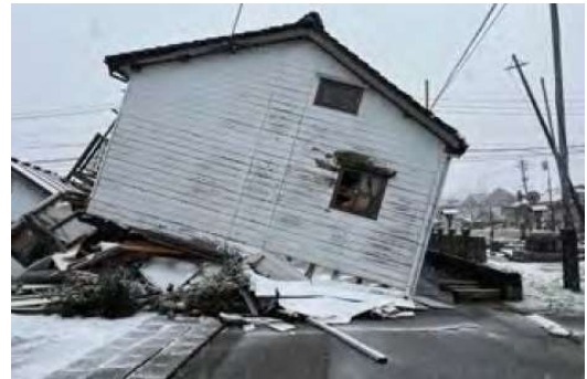
令和6年能登半島地震