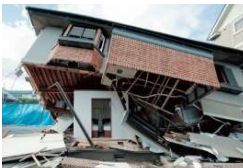
耐震シェルター

なお、2000年基準以前の木造建築物については、国の動向や令和8年度策定予定の静岡県第5次地震被害想定に注視しつつ、支援の在り方について研究していく。