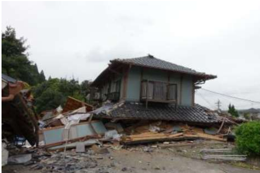
平成28年熊本地震

令和6年1月の能登半島地震では、杭頭の破壊が主な原因としてビルが倒壊するとともに、大規模な市街地火災、津波、地盤の隆起や液状化による宅地被害、道路被害による山間地の孤立など多くの事象が発生した。また、震災後の調査により高齢化率の高い地域において相対的に耐震化率が低いことが明らかになった。