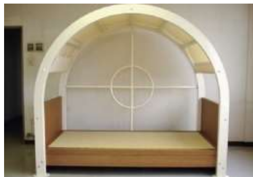
防災ベッド