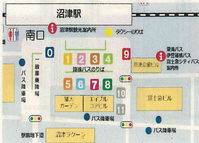
【変更前（令和2年3月31日より）】