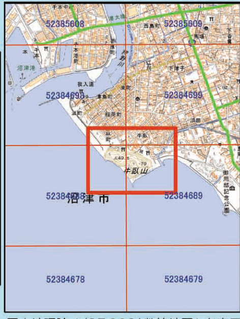
国土院 1/25,000(数値地図)を表示