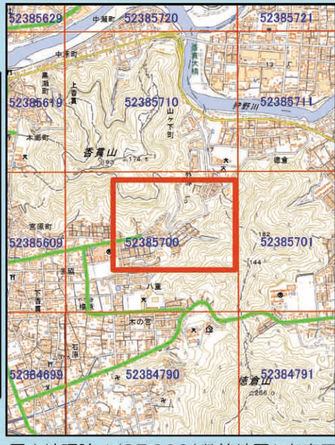
国土地理院 1/25,000(数値地図)を表示