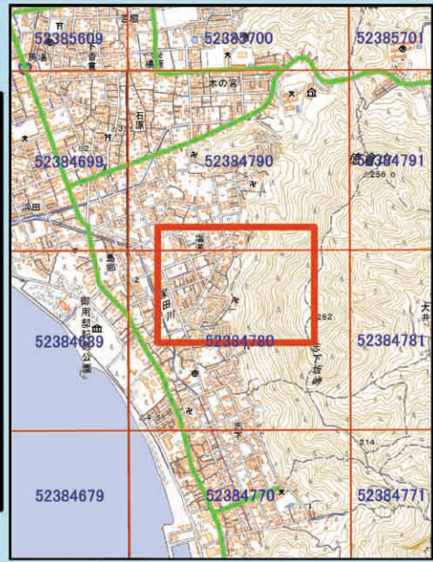
国土院 1/25,000 (数値地図) を表示