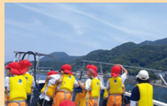
漁協の協力による漁船乗船体験

各小中学校が独自に外部人材を活用して、特色ある地域交流、体験学習、校外学習を行う「チーム学校」を進めています。