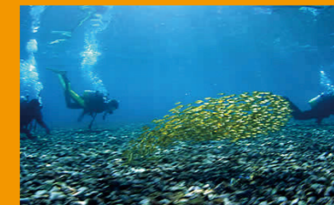
スキューバダイビングのメッカの大瀬崎

沼津港・ダイビングスポット・日本でもトップクラスの良質な海水浴場など、ぬまづの海には魅力がいっぱい！海を活用したにぎわいのあるまちづくりを進めていきます。