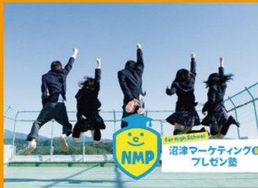
沼津マーケティング&プレゼン塾

高校生と地元企業をつなぐ活動や、音楽などのイベントで地域の人をつなぐ活動など、民間が主体となった「まちづくり」を支援する「民間支援まちづくりファンド事業」を実施しています。 また、金融機関と民都機構がタッグを組んで支援する「マネジメント型まちづくりファンド」が、全国初の事例として沼津市に設立されました。