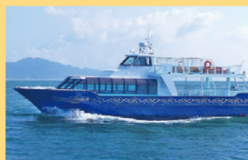
快速遊覧船ドリーム☆スター号