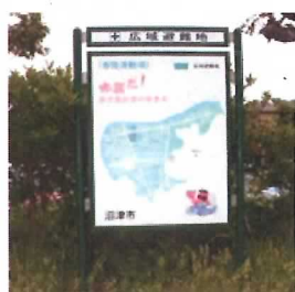
10 広域避難地標示看板