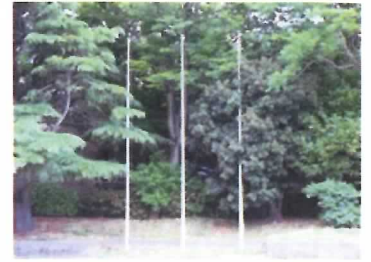
93 掲揚台・掲揚ポール③