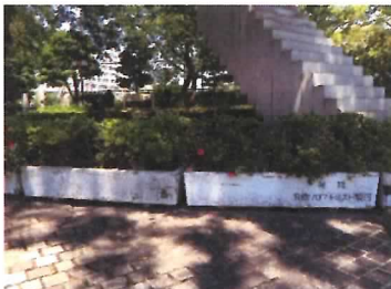
50 コンクリート製フラワーポット