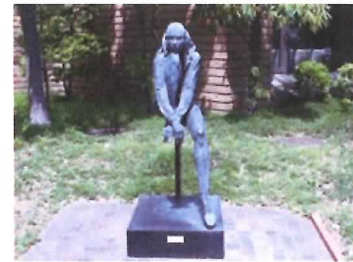
56 ブロンズ像 (NIKE)