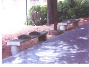
88 ベンチ (2基)