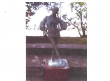
100 ブロンズ像 (若い女・夏)