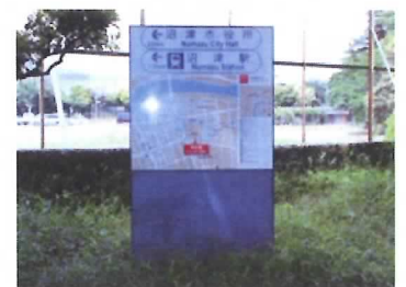
42 歩行者用観光案内板