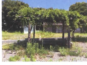
86 藤棚③ (ベンチ3基含む)