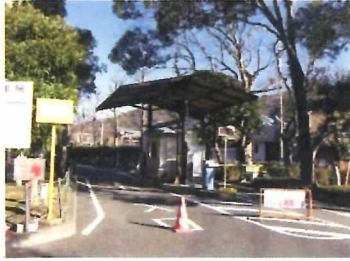
61 駐車場発券機・精算機 ゲートバー・管理人室等