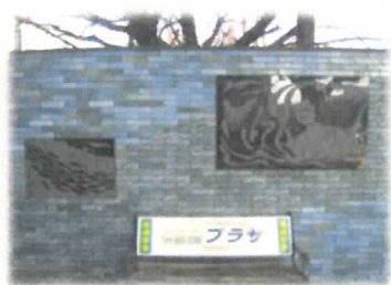
1 ベストポケットスクエア