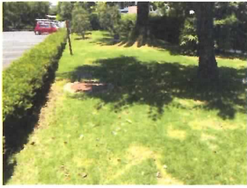
76 耐震性防火水槽 (40 t)