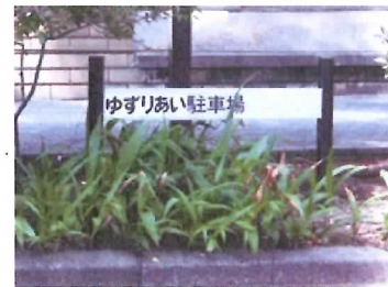
59 施設案内看板 (ゆずりあい駐車場)