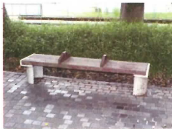
22 ベンチ (1基)