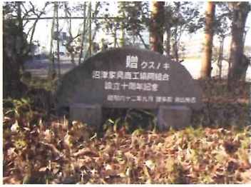
46 沼津家具商工協同組合 設立十周年記念碑