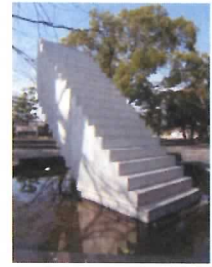
48 モニュメント (無限空間へ)