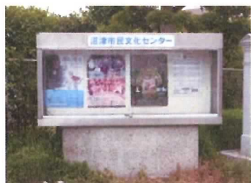
13 文化センター掲示板