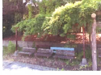
89 藤棚⑤ (ベンチ3基含む)