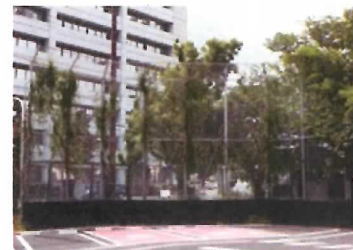
6 バックネット (H=8m)