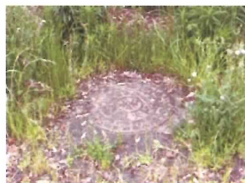
28 耐震性防火水槽 (100 t)