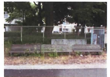
36 ベンチ (3基)