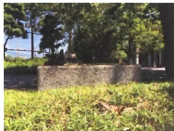
23 コンクリート基礎