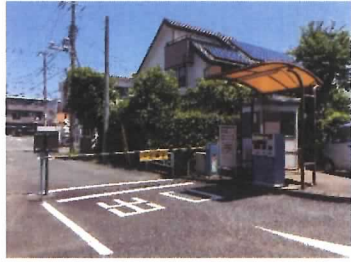
80 精算機・ゲートバー・屋根