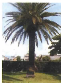
77 在市朝鮮民主主義人民共和国 公民帰国者記念植樹碑