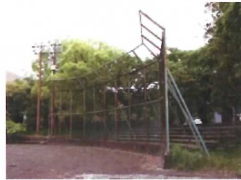
38 バックネット (H=5m)