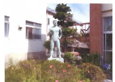
72 ブロンズ像 (創立10周年記念)