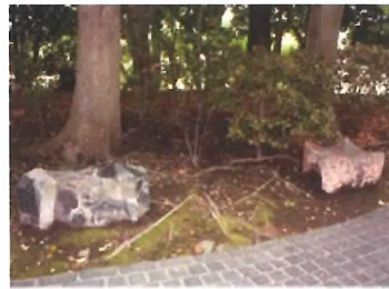
98 花崗岩ベンチ (2基)