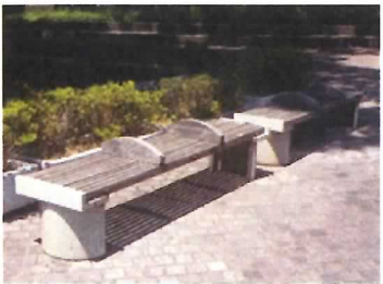
49 ベンチ (3基)