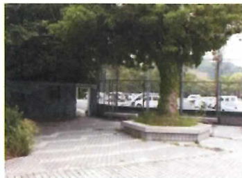
2 御影石六角ベンチ