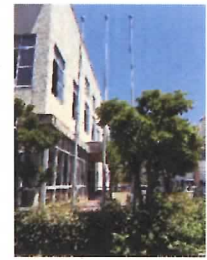
66 掲揚台・掲揚ポール②