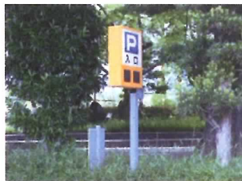
25 駐車場満空表示板