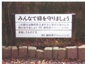
41 グリーンバンク看板①