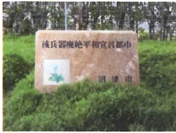
16 核兵器廃絶平和宣言都市碑