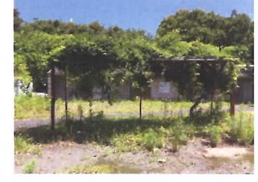
87 藤棚④ (ベンチ3基含む)