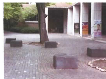
101 伊豆石ベンチ (5基)