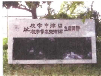
44 沼津中学・東高址校歌碑