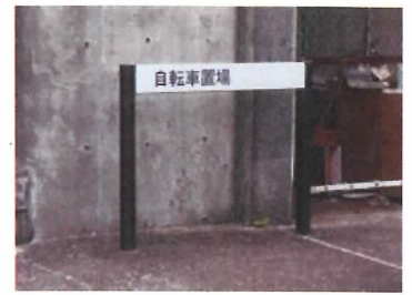
78 施設案内看板 (自転車置場)