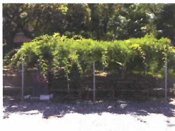
40 藤棚② (ベンチ3基含む)