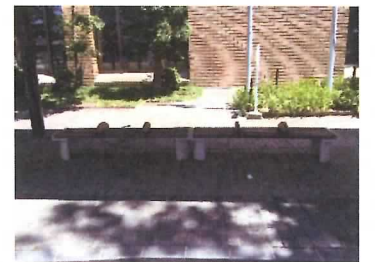
57 ベンチ (2基)