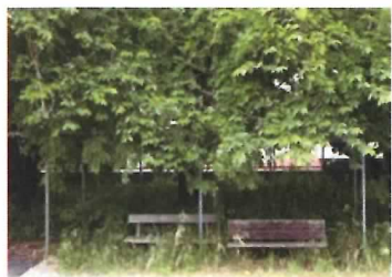
4 藤棚① (ベンチ2基含む)