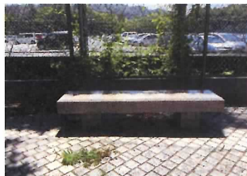
5 御影石ベンチ (2基)