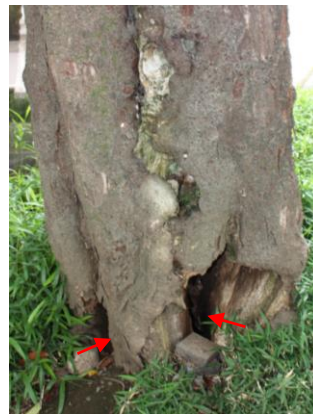
幹の欠損や空洞化