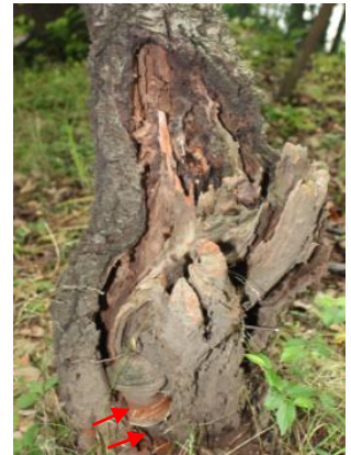
材質腐朽菌の発生