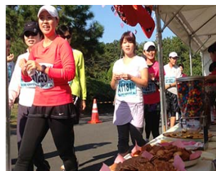
2/24 沼津スイーツラン