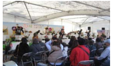
11/23~25 花・緑・タウンフェア