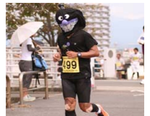
3/24 狩野川リレーラン