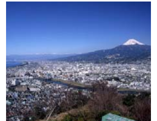
2/16・17 沼津ランニング グモニターツアー