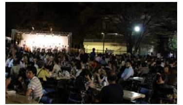
9/13~15 沼津自慢フェスタ