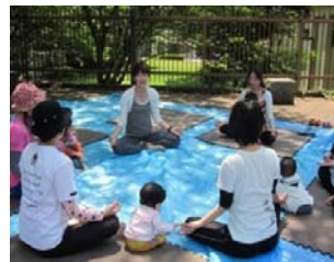
1/24・2/21・3/7 親子 de わくわく運動教室