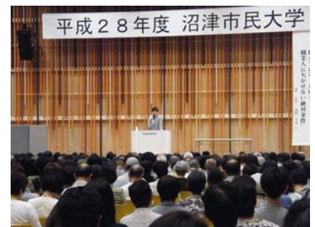
※ 写真は平成 28 年度の様子

今年度の市民大学は、「しなやかに、強かに生きる」をテーマに、変化の多い社会の中でも、ストレスに負けず充実した毎日を送るための智慧や方法を学べるような講義を開催します。波乱万丈の人生を歩まれてきた俳人の夏井いつきさんをはじめ、作家で数学者の藤原正彦さん、テレビで活躍中の生物学者 池田清彦さんなど、日本を牽引する超一流の講師陣にご講演いただきます。また今回は、義足エンジニアの遠藤謙さん等、多方面で活躍する沼津市出身講師を 3 名お招きします。