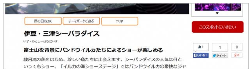
▲「行きたいリスト」イメージ

「このスポットに行きたい」ボタンをクリックし、お気に入りスポットをリスト化します。自分だけの観光ポータルサイトにカスタマイズできる機能です。