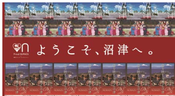
おもてなしパネル イメージ