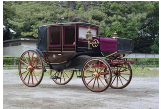
展示する普通馬車3号

現在は、外国の駐日大使が天皇陛下に信任状を捧呈する際、東京駅から皇居まで馬車を利用される場合に、随伴員用の馬車として使用されています。