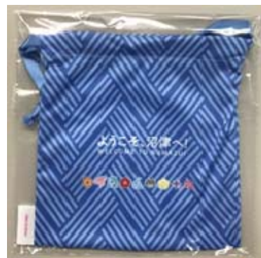
「ラブライブ！サンシャイン!!」コラボ 巾着袋

この巾着袋は、事前に配布を希望した市内の宿泊施設において、 期間中、おもてなしグッズとして配布されます。