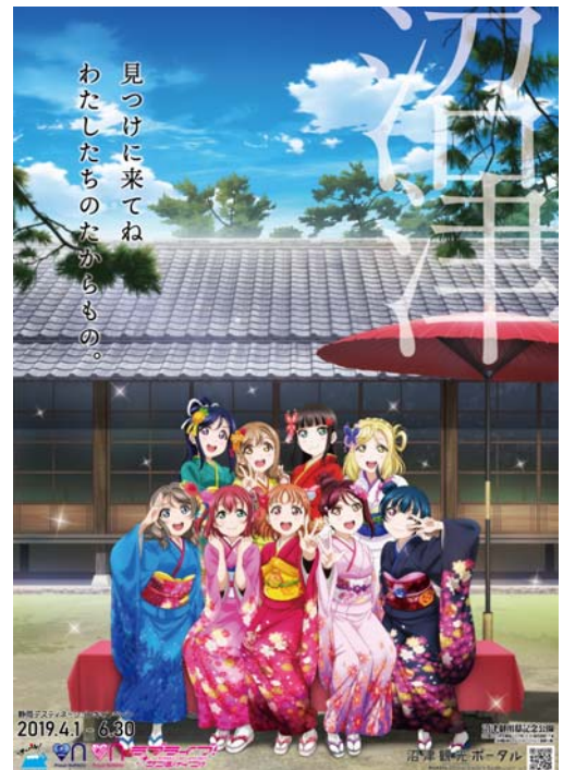
「ラブライブ！サンシャイン!!」コラボ ポスター

ポスターの背景は、沼津を代表する名勝で、改元により注目を集める沼津御用邸記念公園です。