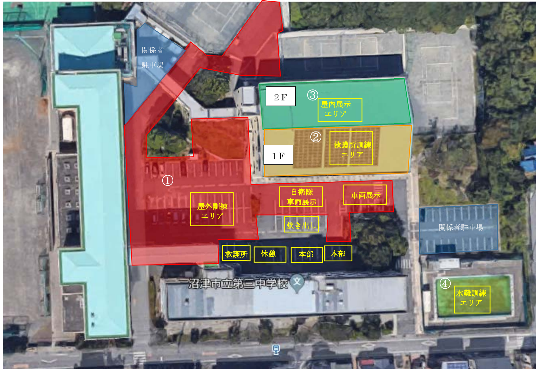
訓練会場 レイアウト図