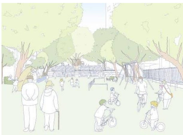
仮設の大階段でつながる上下の広場

※ 各設置物については、適宜配置等の変更を行い、令和6年2月末ごろまでの設置を予定しております。