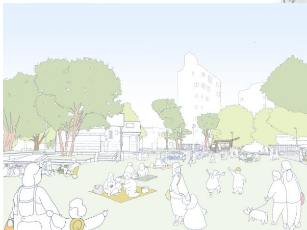
南側広場から見たイメージ図