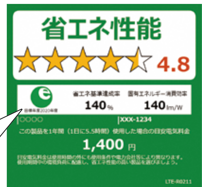
店頭に表示されている省エネラベルの例