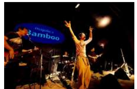
アトラクション 名古屋のろう者たちの手話ロックバンド 「BRIGHT EYES super-duper」