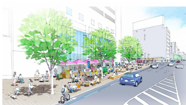
将来的な公共空間活用イメージ