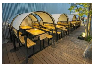
屋根付きベンチテーブル