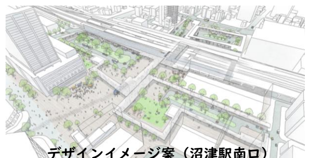
デザインイメージ案（沼津駅南口）