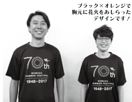
ブラック×オレンジで胸元に花火をあしらったデザインです！