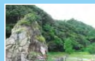
▶海底火山のなごりてある小さな山が見られる我入道

伊豆半島ジオパークを構成するジオ ポイントは市内にも多数存在し、特色 ある自然を観察することができます。 そんな市内にあるジオポイントの一部 を紹介します。