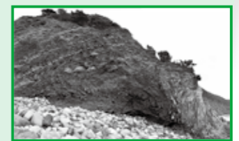
▲火口から噴き出そうとした溶岩が放射状に積み重なっている。