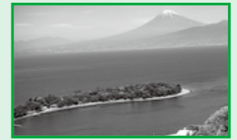
▲海岸沿いの海流によって運ばれた岩や土砂がたまってできた砂嘴(さし)という地形。