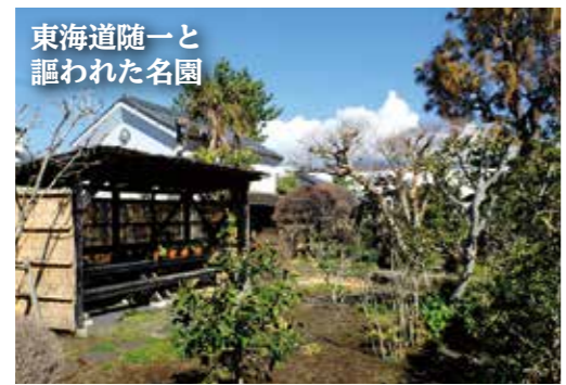
東海道随一と謳われた名園

松やソテツの盆栽や桜草、松葉蘭などの鉢物、ポタンや菊などの花壇が美しく、東海道を行き来する要人たちにも愛され、なかでもドイツ人医師シーボルトは「今迄日本にて見たるもののなかにて最も美しく、また鑑賞植物に最も豊かなるものなり」とその美しさを著書に記しています。