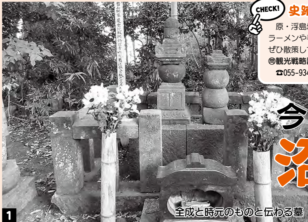
全成と時元のものと伝わる墓