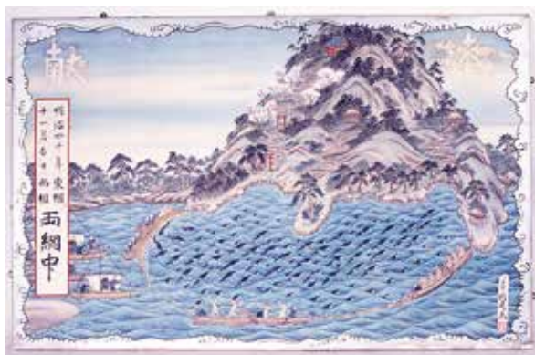
明治40年奉納建切網漁絵馬(金桜神社) 60.5cm × 90.5cm

今回指定された奉納絵馬は、額に入った大型の絵馬で、そこに描かれている内容は主に明治・大正期から昭和初期に描かれており、近世以前から近現代に至るまでの地域の漁業史を具体的に物語る貴重な資料です。また、当地の漁村の人々の生活を支えてきた漁業に対する信仰の特徴を示す民俗学的にも貴重な資料であり、今後継承していくとともに、劣化や散逸を防ぐ必要があると判断されたため、市指定有形民俗文化財として指定されました。