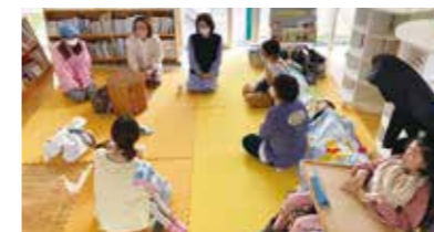
◀医療的ケア児のママ交流会 出会いづらい状況にあるママ同士 が気軽に情報交換できる場づくり