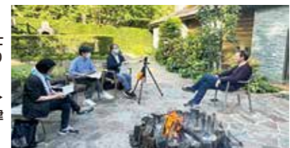
▶移住経験者へのインタビュー 移住者や移住予定者のための沼津 暮らし応援本「沼住」の制作