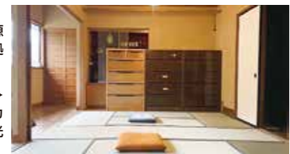
▶空き家を活用した拠点整備 元旅館をリノベーションした、カ フェ・コワーキングスペース観光 拠点施設