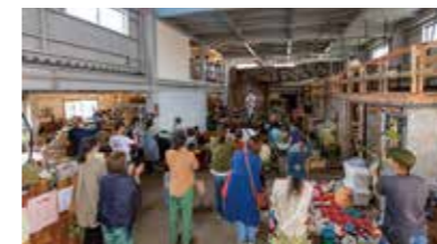
◀循環ワークス 元工場をリノベーションし、資源 の有効活用について考える交流拠 点施設