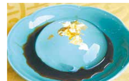
藤井棋聖はおやつには水神餅をチョイスし、これに加えてアイスコーヒーもオーダーしました。