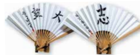
第92期棋聖戦の際に、藤井棋聖(右)と渡辺名人が揮毫した扇子は沼津御用邸記念公園で見学することができます。

第94期棋聖戦は、第一局をベトナムで、第二局を兵庫県洲本市のホテルニューアワジで開催したあと、わたしたちのまち沼津にやってきます。