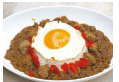
第92期棋聖戦の際に、藤井棋聖が食べたキーマカレー。沼津御用邸記念公園内の洋食店「娛洋亭」の人気メニューとなっています。

沼津土産として持ち帰ってほしいスイーツを募集し、応募結果に基づいた沼津ならではのスイーツセットを対局終了後にお渡しします。