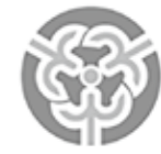
沼津市民憲章マーク

市民憲章は、市民が沼津を愛し互いの幸せを願い、心豊かに生活を送れるよう、まちづくりの規範として、市制50周年を記念して昭和48年に制定されました。