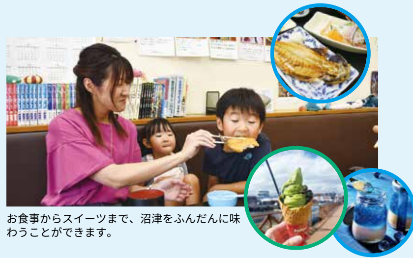
お食事からスイーツまで、沼津をふんだんに味わうことができます。

沼津港では、ジャズや生演奏などが楽しめる「食と音楽」がテーマの「ぬまづ港の街BAR」をはじめ、大小のイベントが開催されるなど、訪れる人を飽きさせない取組が行われています。訪れた人たちが様々な形で魅了する沼津港。ぜひイベントにも足を運んでみてください。