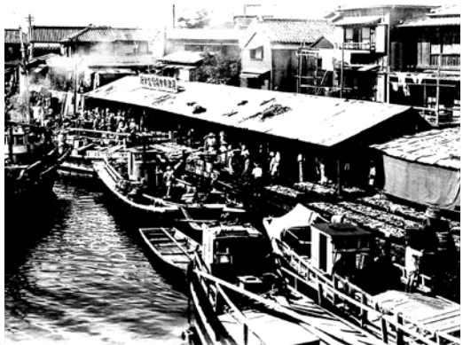
昭和初期の沼津魚市場営業所(魚町)

伊豆半島の付け根に位置する沼津は江戸時代より魚を取り扱う問屋・仲買・小売業が発展してきました。 明治・大正期の沼津港は狩野川の川岸に市場を開いており、御成橋から永代橋の川岸にかけて石蔵が建ち並び、物資や漁獲物の集散地、また、三津・戸田・松崎方面を繋ぐ西伊豆航路船の発着港としてにぎわっていました。現在でも魚町辺りには蔵の面影が残っており、歴史を感じることが出来ます。 その後、大型船も接岸できる施設の整った港を築造しようとする動きが広まり、昭和8年に県営事業として港灣が整備されました。 現在の千本港町に開港した沼津港は、海上交通、海上輸送、水産物の物流の拠点としての役割を担うこととなりました。戦後、産業の急速な発展に伴い、昭和45年には外港が増設され、今の沼津港の姿が出来上がります。現在は、主に外港は金属類などの物流分野、内港は魚の水揚げに利用されています。