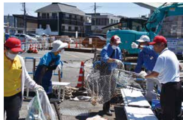
沼津港振興会による沼津港清掃活動の様子