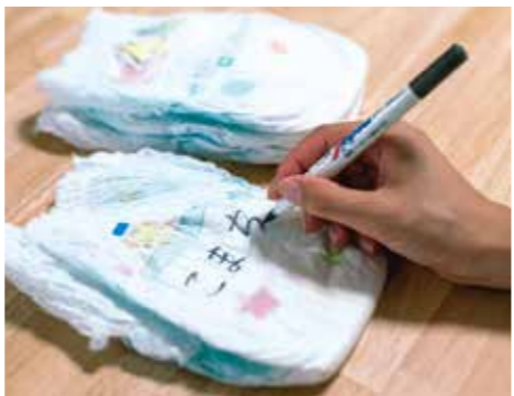
これまではひとつずつのおむつに記名したうえで、使用済みの紙おむつを持ち帰っていました。

保護者からは「お迎えに行ったついでに買い物ができるようになったのは嬉しい」「ひとつずつ名前を書くだけでも大変だったんです。随分ラクになりました」と喜びの声が届いています。