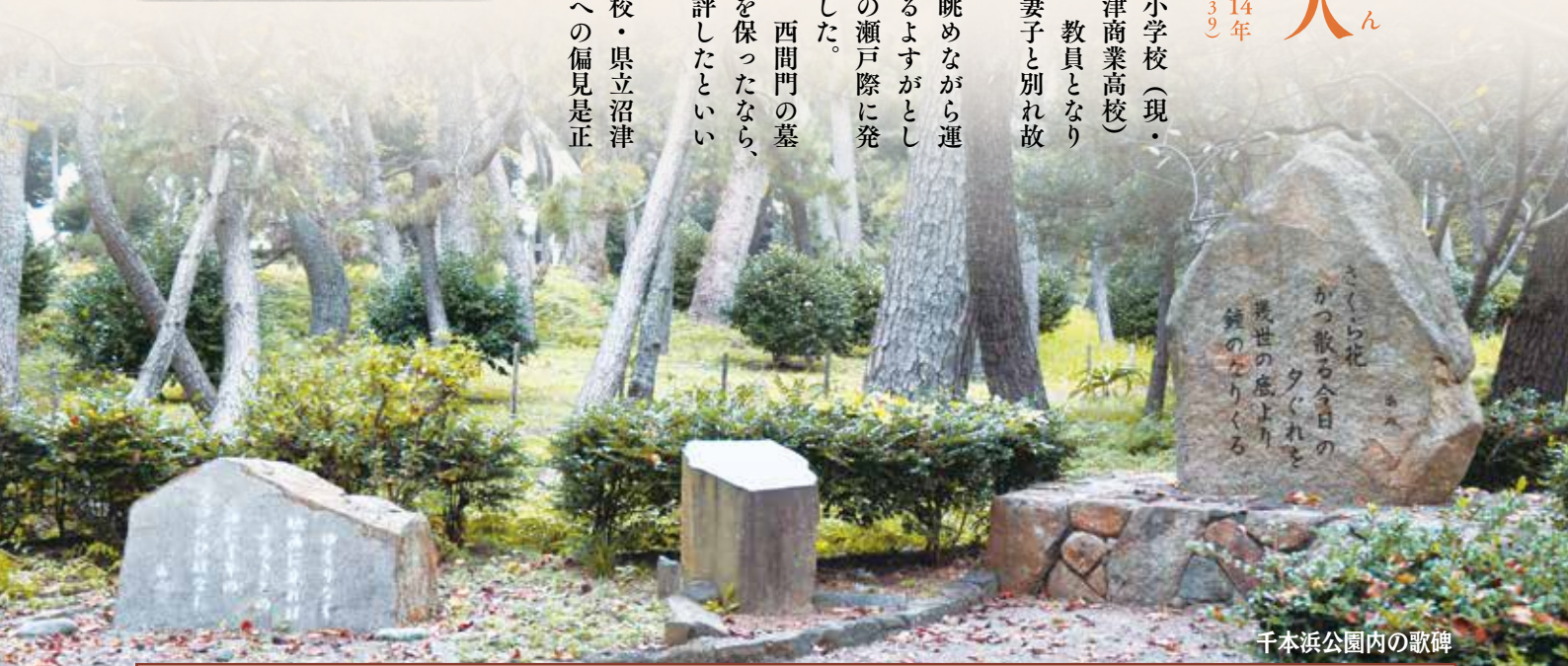
千本浜公園内の歌碑