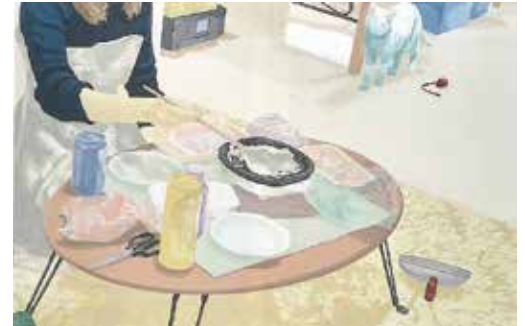
シルクスクリーン 縦124cm×横172cm

私は日々の中で何気なく撮影している自分の日常風景写真をもとにタブレットを使ってドローイングを描き、版画作品に展開しています。