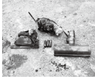
火元と思われるバッテリー

今年は10月の事故のほか、7月にもリサイクル処理施設において、市が引き渡したプラスチック製容器包装の中に、充電式電池が混入していたことが原因と思われる発煙事故が発生しています。