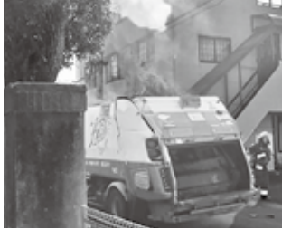
出火したごみ収集車両