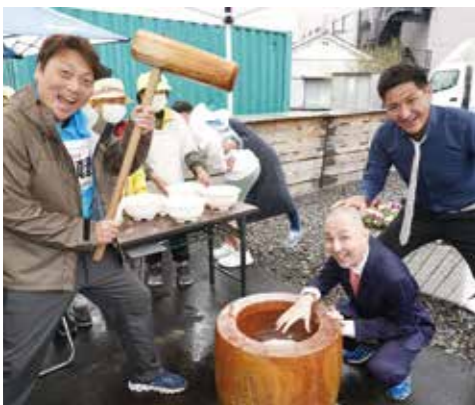
寛平アメナイトマラソン in沼津 今年で4回目のこのマラソンは、中央公園をスタートして、狩野川や千本浜など沼津の夜景を満喫しながら走る大会です。走るだけでなく、お笑いライブや高校生のパフォーマンス、地元のグルメなども堪能することができます。詳細は、裏表紙をご覧ください。

漫才をやっている若手芸人も沼津のことを気に入っているみたいですね。ある時タクシーの運転手さんに「沼津のまちが昔に比べると寂しいから、なんか盛り上がることはない？」って言われて、「沼津は夜景もええ感じやし、ナイトマラソンとかええんちゃうかな」ってひらめいたんですね。 【市長】 師匠のご提案はとても嬉しかったです。やったことがないからこそ挑戦だし、駿河湾に沈む夕日や香貫山の夜桜など沼津を楽しめる。「これは面白いぞ」と思いました。 【寛平】 僕もいいアイデアだなってびっくりしたわ(笑)。