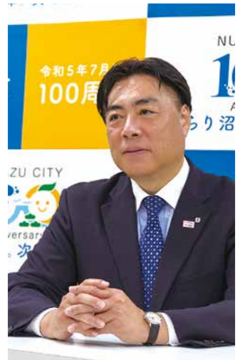
頼重秀一(よりしげしゅういち) 1968年、沼津市生まれ。平成15年に沼津市議会議員に初当選。その後、第83代市議会議員を務め、平成30年に沼津市長に就任。市長として多数の施策を展開すると同時に、X・Facebook・Instagram等のSNSを駆使し、広く親しみやすい情報発信に挑戦中。

【市長】 お話を聞いて、師匠も同じような想いで取り組んでおられるんだなと嬉しくなりました。若い人たちは自分たちの想いを伝えたり、実力を発揮したりするという環境があまりないんですよ。職員にも「市長だからと臆することなくアイデアをぶつけてほしい」と話しています。そして「ここは市長に動いてほしい」となったら私自身が行動を起こす。トップが一番働く組織が私の理想なんです。