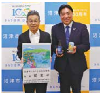
ふるさと納税応援隊長にも就任していただいています。沼津市のふるさと納税も好評です。