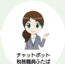
チャットボット 税務職員ふたば

所得の申告は様々な行政サービスの基礎資料となる大切な手続きです。申告が必要な人は、必要書類を準備の上、期限までに申告をお願いします。