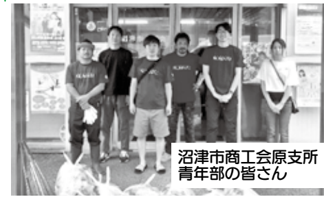
沼津市商工会原支所 青年部の皆さん

私たちの活動は、シンプルに道路のごみ を拾うこと。時間は30分くらいのこともあ れば、1時間以上行うこともあります。 まちをキレイにするって、単純なように 見えてけっこうやりがいがありますよ!