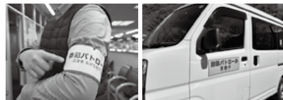
ながら見守り活動に登録していただくと、腕章か車両マ グネットをお渡します。

対 象 ①市内に住むか、通勤・通学する18歳以上の人 ②市内に事業所を置く事業者・団体等 申込方法 ①市ホームページまたは市役所2階生活安心課にある申請 書と本人確認書類を直接 ②は登録前にお問い合わせください。