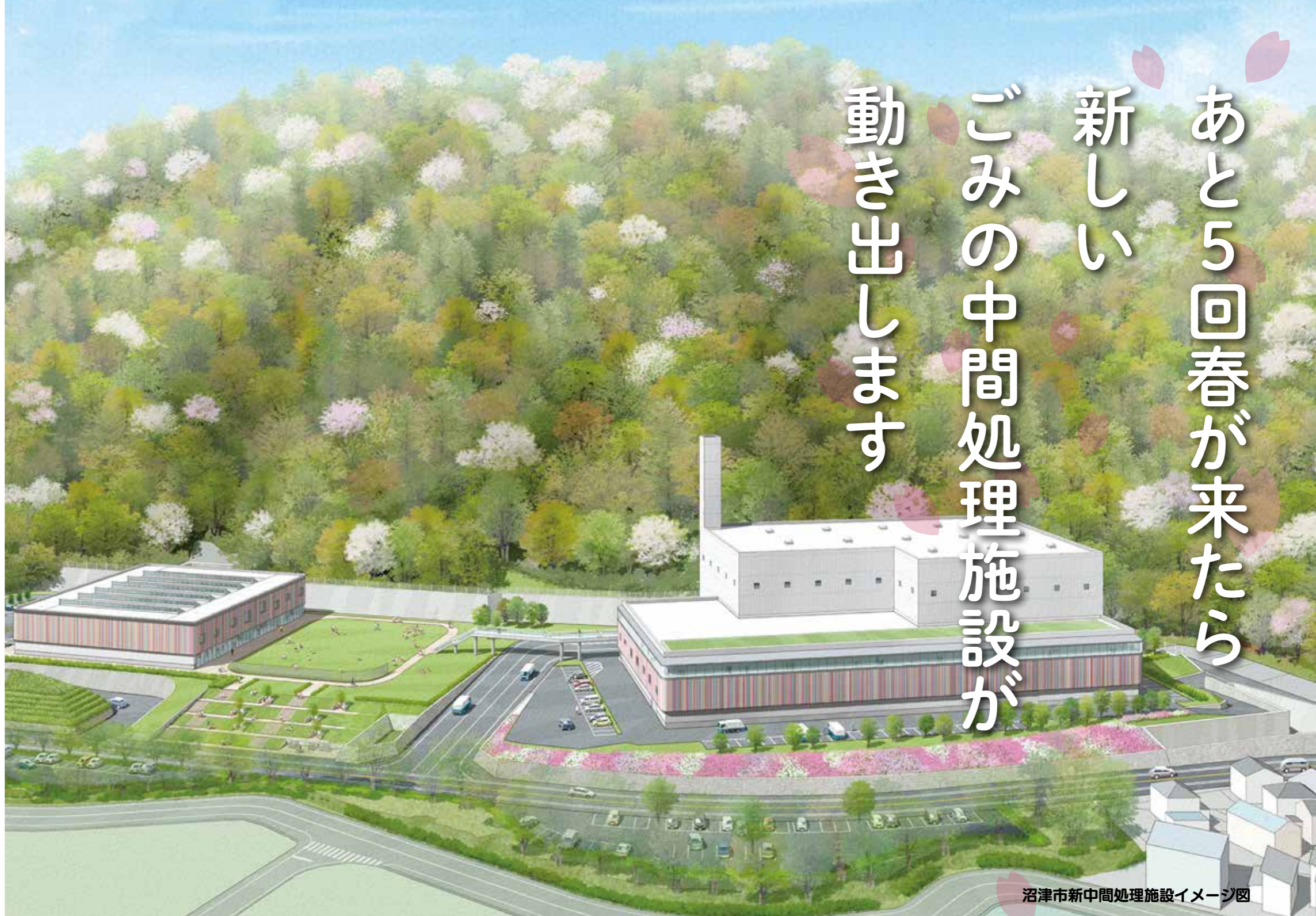
沼津市新中間処理施設イメージ図