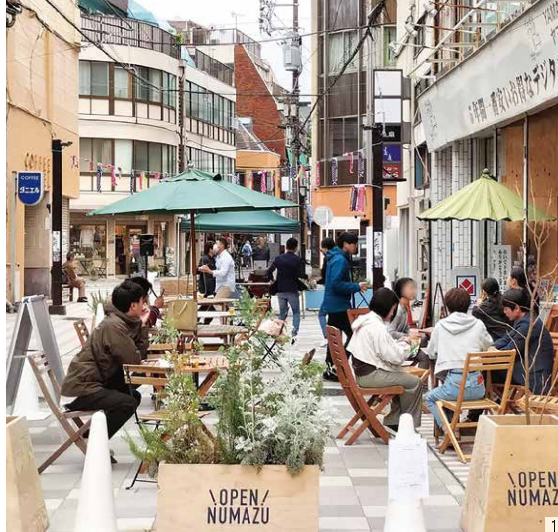
1. 人が自然と集まる居心地のいい場所として生まれ変わった沼津新仲見世商店街 2. 毎回多くの人でにぎわった週末の沼津 3. 廃業した旅館をリノベーションした Hostel Tagore-タゴール- 4. 企業版リノベーションスクールで語り合う民間の担い手と市職員