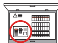
分電盤内蔵タイプ (新規または取替)