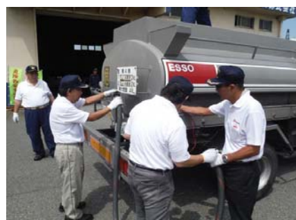
(参考) 昨年の検査の様子