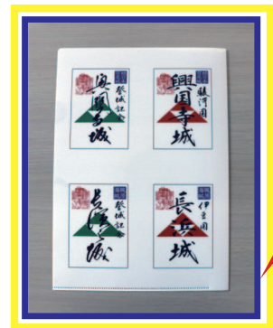
興国寺城跡・長浜城跡の 御城印クリアファイル!