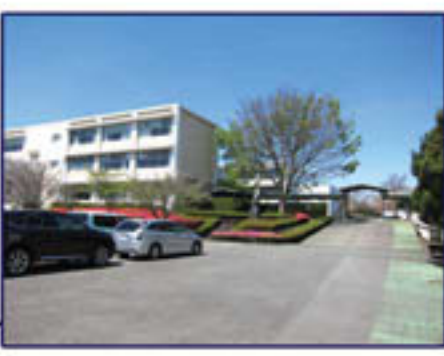
沼津東高等学校内詩碑位置図