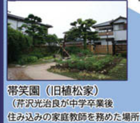
帯笑園 (旧植松家) (芹沢光治良が中学卒業後 住み込みの家庭教師を務めた場所)