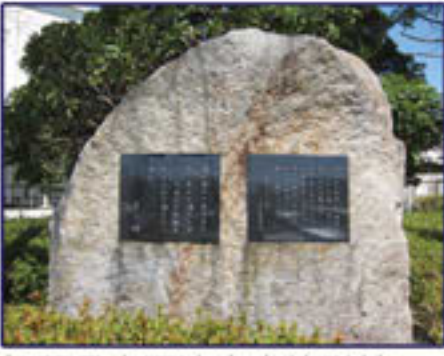
静岡県立沼津東高等学校 (校内に芹沢光治良・井上靖 ・大岡信詩碑)