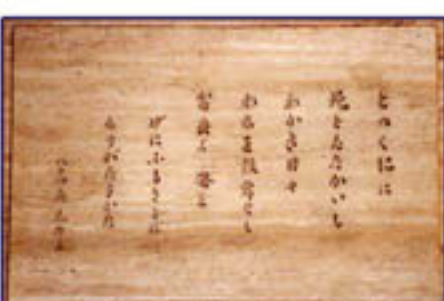
沼津市民文化センター内 芹沢光治良詩碑