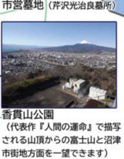
市営墓地 (芹沢光治良墓所) 香貫山公園 (代表作『人間の運命』で描写 される山頂からの富士山と沼津 市街地方面を一望できます)