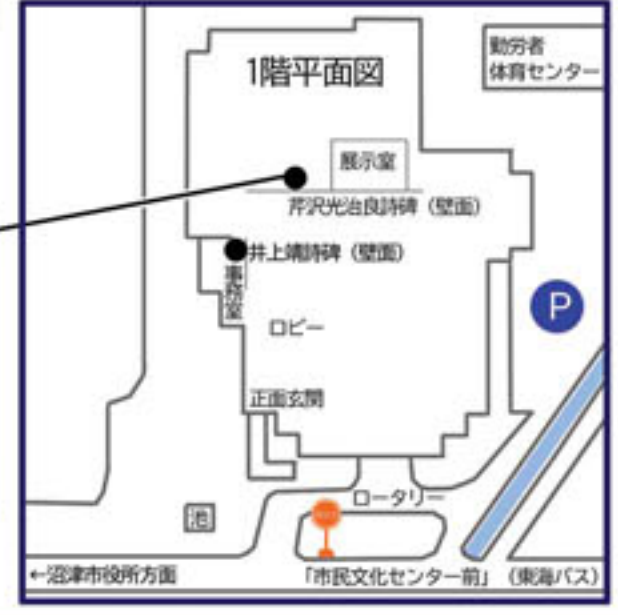
沼津市民文化センター内詩碑位置図