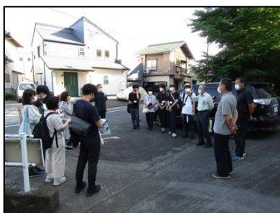
【住民意見の聞取り】