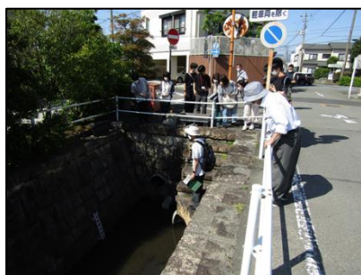
【フィールドワーク】