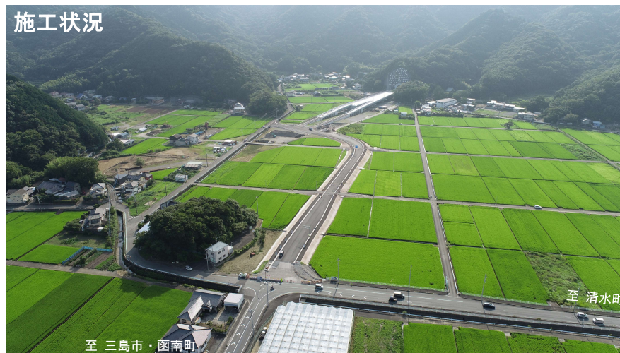
東側より西側を望む (令和4年9月撮影)