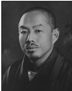
若山牧水